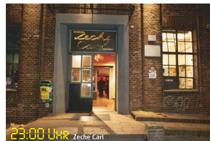
23:00 UHR Zeche Carl