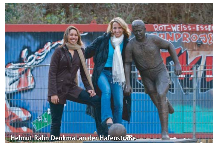
Helmüt Rahn Denkmal an der Hafenstraße