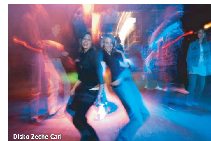
Disko Zeche Carl