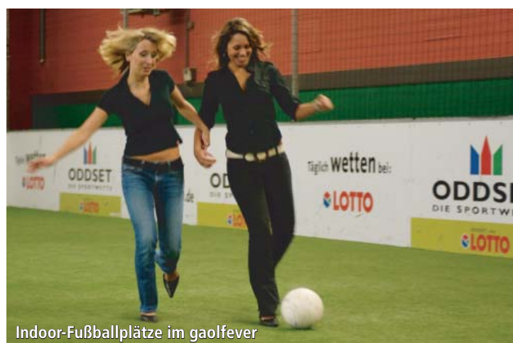
Indoor-Fußballplätze im goalfever