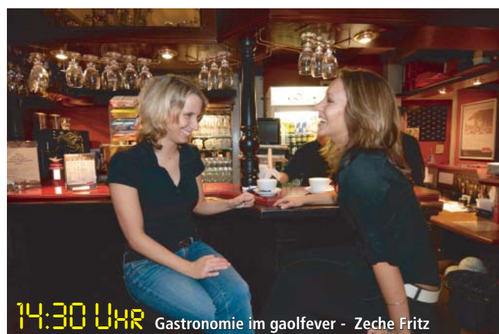
14:30 Uhr Gastronomie im goalfever - Zeche Fritz