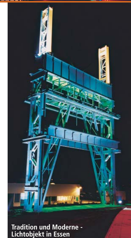
Tradition und Moderne - Lichtobjekt in Essen

Wilhelm-Nieswandt-Allee 100 – 45326 Essen – 0201-8344470 – www.zechecarl.de