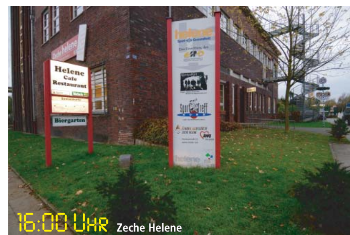
16:00 Uhr Zeche Helene