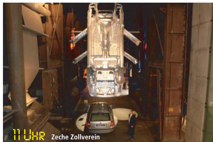
11 Uhr Zeche Zollverein