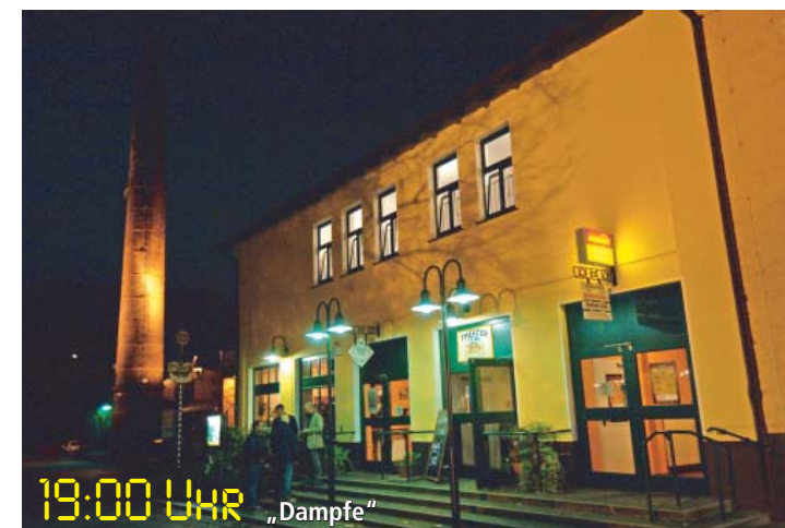
19:00 UHR „Dampfe“