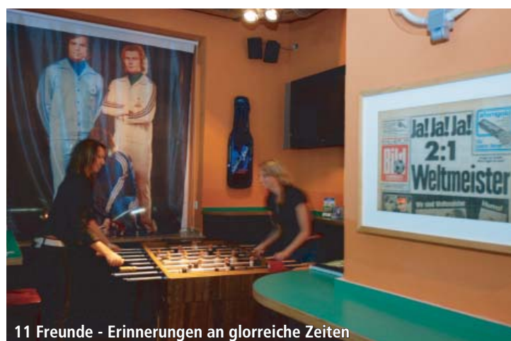
11 Freunde - Erinnerungen an glorreiche Zeiten