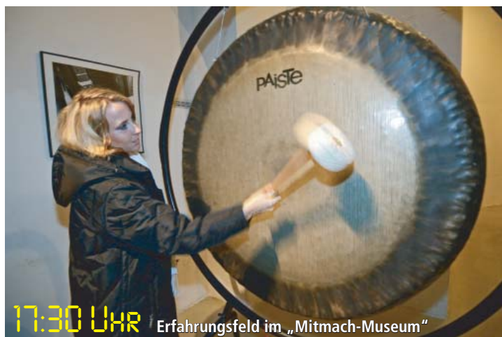
17:30 UHR Erfahrungsfeld im „Mitmach-Museum“