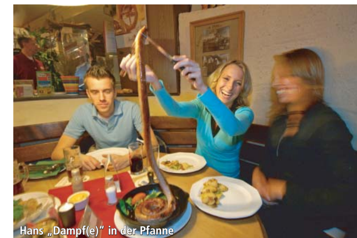
Hans „Dampf(e)“ in der Pfanne