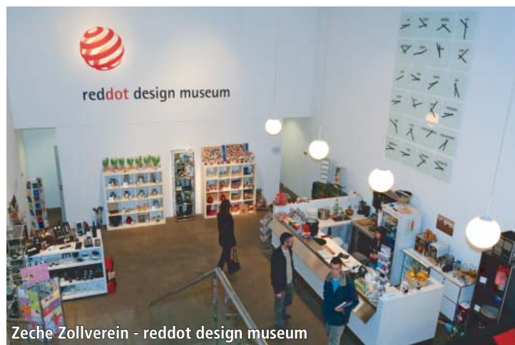
Zeche Zollverein - redden design museum